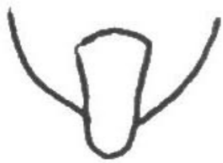
图 118 强条蜂 Anthophora (P.) balneorum ♀

雌体长 14mm；胸部及腹部第 1 节背板被黄褐色毛。唇基具斜向排列的密的刻点；上唇较粗具皱；唇基（侧面观）较复眼窄（1:0.8）；颚眼距极短；触角第 1 鞭节长于节